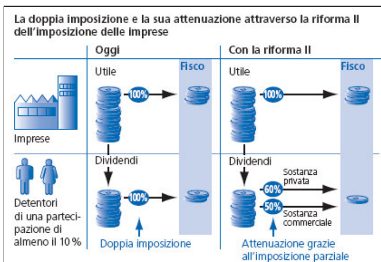
Grafico 1 (fonte: DFF)